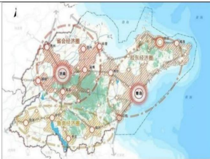
▲山东省区域和城镇协调布局图